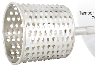
Tambor Ralo Grosso Cód.2501/3