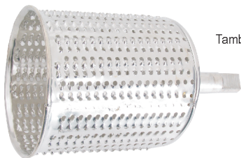
Tambor Ralo Médio Cód.2501/2

OBS: para o melhor desempenho ao ralar côco recomenda-se resfriar a fruta por algumas horas antes de utilizá-la.